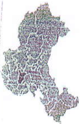
موقع بداية تفشي المرض في المنطقة

غير معروفة حالياً ومبدئياً تتراوح ما بين 1-2 يوم