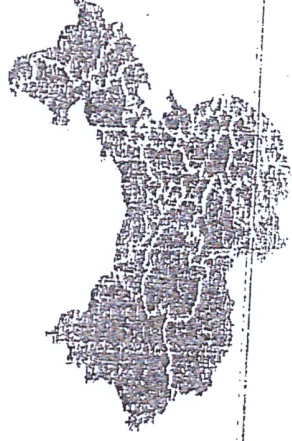
موقع مدينة ووهان في مدينة ووهان الصينية